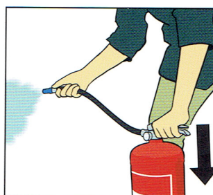
Tryck ner handtaget.