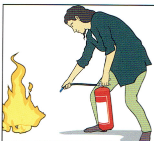
Rikta mot branden.