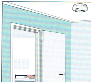
Brandvarnaren ska sitta i taket.

En brandvarnare larmar snabbt om det börjar brinna. Då hinner du släcka eller ta dig ut om det behövs. Ha minst en brandvarnare på varje våning och gärna en i varje rum.