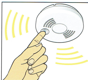
Prova den en gång i månaden. Tryck på testknappen.